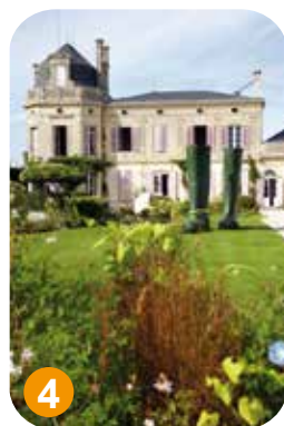
Châteaux Chasse-Spleen et Mauvesin-Barton