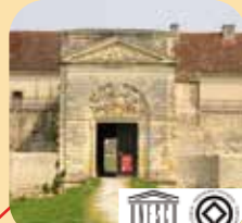
Fort-Médoc, à Cussac, classé au patrimoine mondial de l'Unesco avec le verrou Vauban.