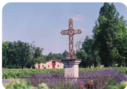
Calvaire du Château Duplessis