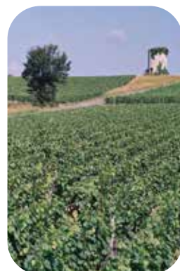
Moulin à Moulis