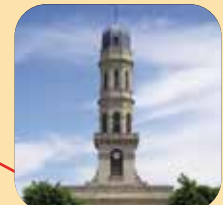
Eglise et dôme à Lamarque. Point de vue sur l'estuaire depuis le clocher.