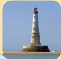
Le phare de Cordouan monument historique classé en 1862.