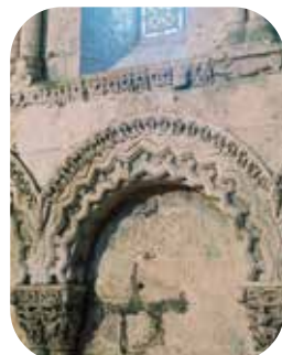
Détails de l'église