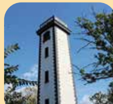
Phare sur l'île de Patiras